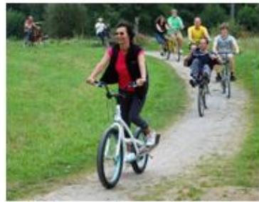
Information und Test

Sie interessieren sich für ein Liegerad oder ein exotisches Reit-, Ruder- Wasser- oder was auch immer Fahrrad? Hier haben Sie die seltene Möglichkeit sich über diese Fahrzeuge zu informieren und können es ggf. nach Einweisung auch zur Probe fahren.